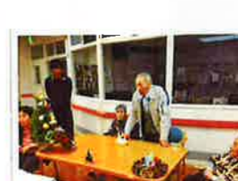
土岐編集長が作成したお二人の思い出 DVD を皆で見ました！お二人のお子様からのメッセージには一同涙腺崩壊(TOT)