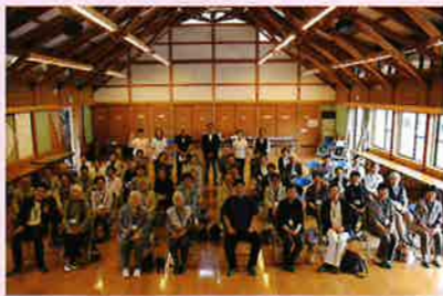
お元気さん集まろう会