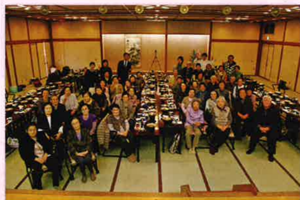
お元気さん忘年会にて