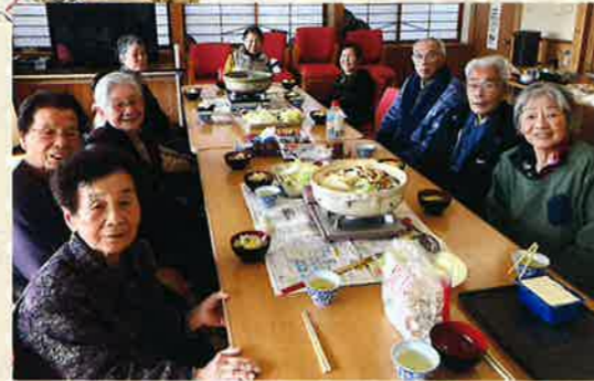
田本と三耕地の方々で 美味しい鍋の前にハイポーズ!