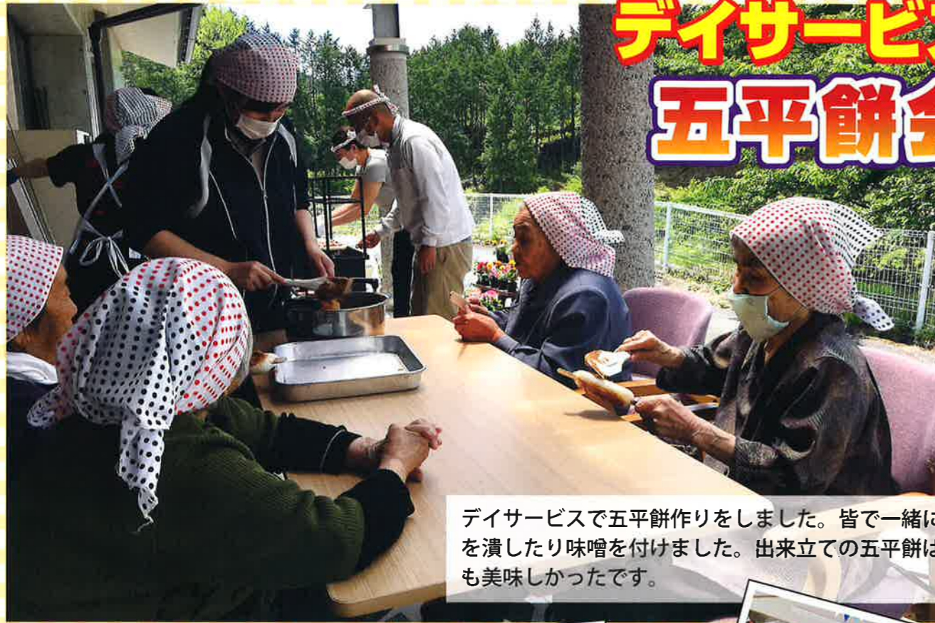
デイサービスで五平餅作りをしました。皆で一緒にご飯を潰したり味噌を付けました。出来立ての五平餅はとても美味しかったです。