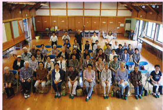
お元気さん集まるう会