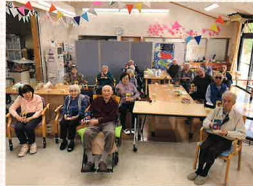
鯉のぼりの作品、ちぎり絵作りをしました。自分で作った作品を持って記念写真を撮りました。