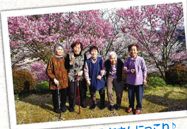
福寿院の桜にみなさんにつこり♪