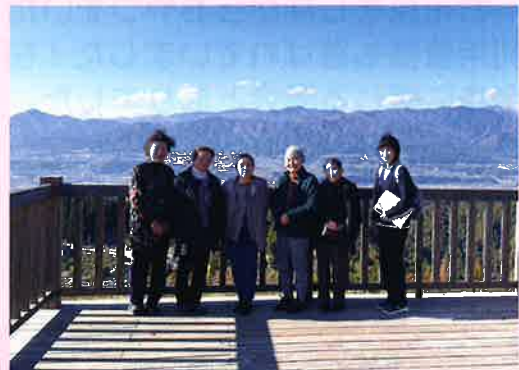
介護者家族の会（豊丘村）