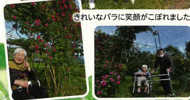
きれいなバラに笑顔がこぼれました