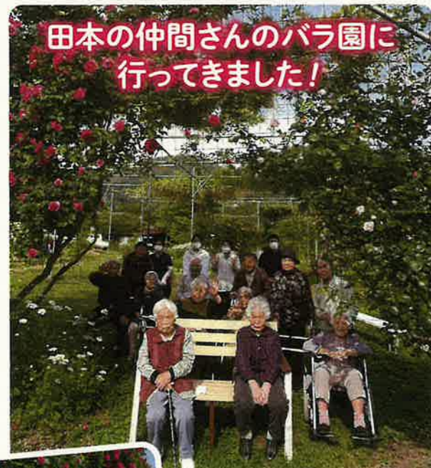
田本の仲間さんのバラ園に行ってきました!

今年も利用者様のご指導のもと野菜づくりをしたり、一緒にお料理をしたり、様々な取り組みを通してより良いデイサービスを築いていきたいと思っております。今後ともよろしくお願いたします。