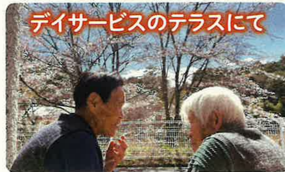
デイサービスのテラスにて