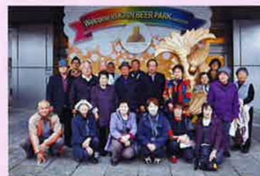
"希望の旅"名古屋麒麟ビール工場にて