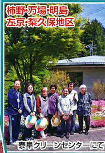
柿野・万場・明島 左京・梨久保地区