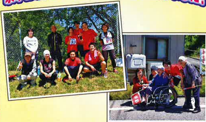
やすおか荘からも応援に来てくれました

寄付をいただきました 手をつなぐ育成会様より ￥6,466 福祉事業に活用させて頂きます。 ありがとうございます。