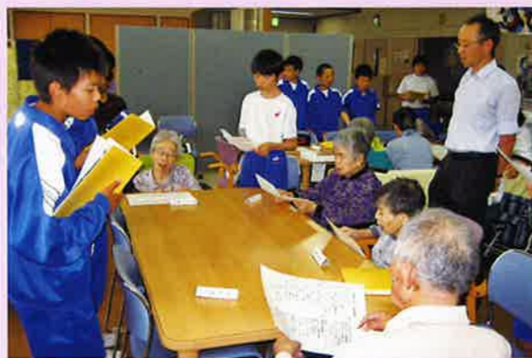
泰阜中学校交流会