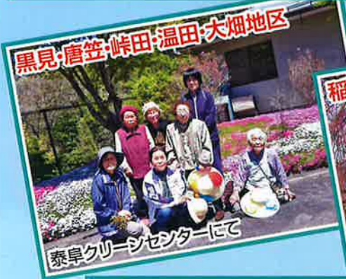
黒見・唐笠・峠田・温田・大畑地区