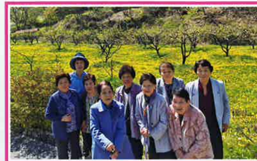
畑一面のタンポポをバックにハイポーズ!