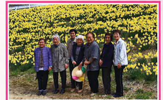
見事な水仙に春を感じる