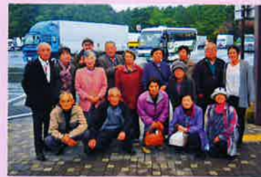
希望の旅 安曇野方面