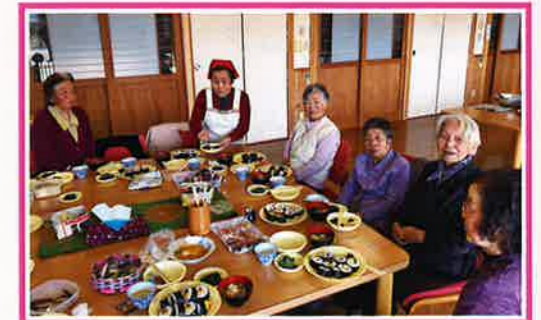
お寿司巻いたよ!美味しかったあ~