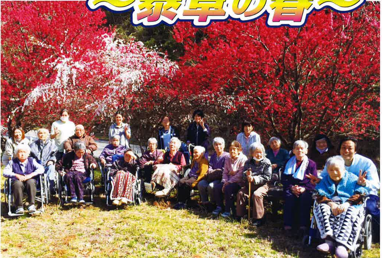
左京生活改善センターにて