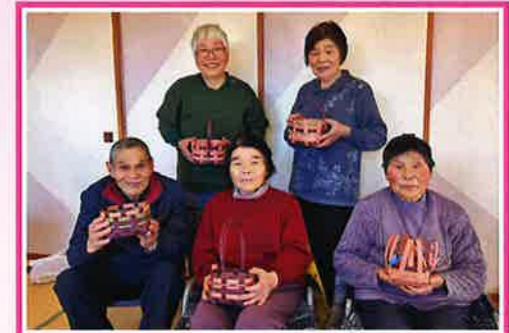
手作りかごに何入れようかなあ~?