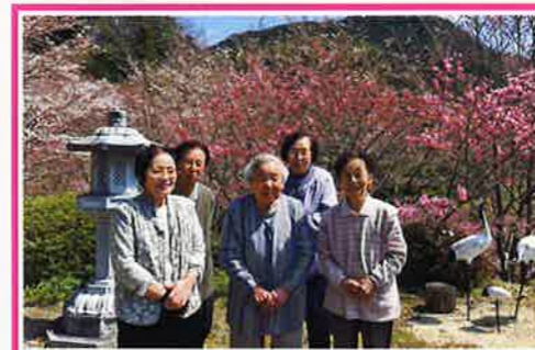
咲き始めの桜に感激!(田本福寿院)