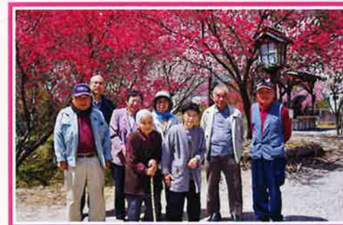
屋神の花桃に皆さんにっこり