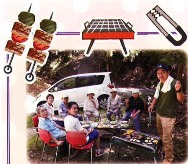
キャリアデーの中学生も参加して栃城でバーベキュー！ 自然の中で食べるお肉は最高！！