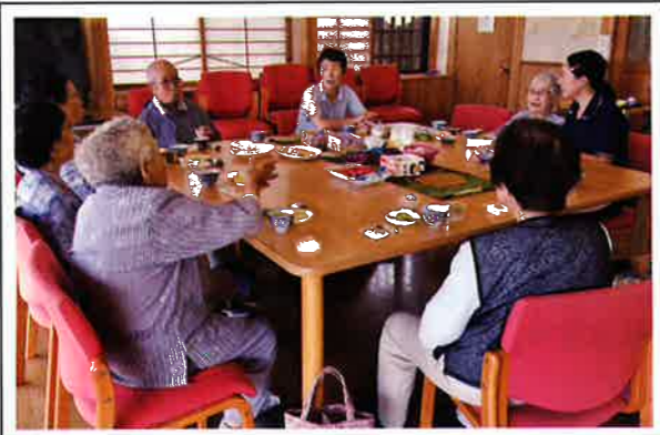
懐かしい友人に囲まれ、笑い、涙し、お昼寝し… 笑顔の絶えない暖かい時間を過ごしました。