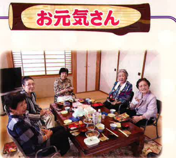
ひだまりの会、絆の会合同昼食会 みんなでワイワイ楽しかったね。