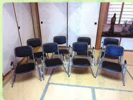
お元気さん用椅子