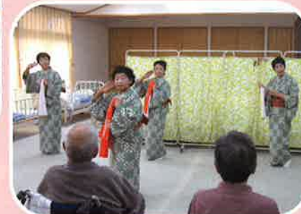
11月11日 「ゆうゆう」訪問