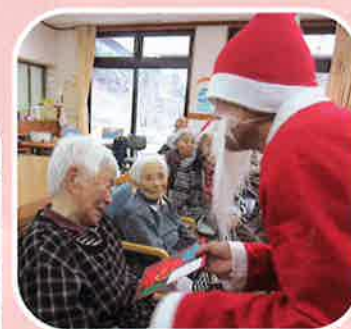
12月23日 クリスマス会