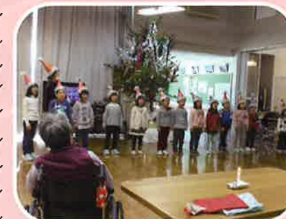
12月22日 やすおか荘 クリスマス会