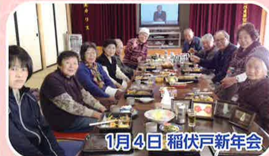
1月4日 稲伏戸新年会