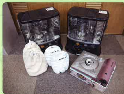
災害用ストーブ 湯たんぽ カセットコンロ