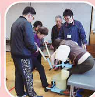
2月3日 介護者家族の会