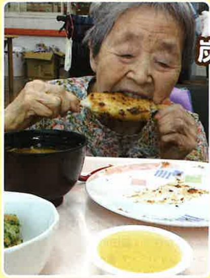
炭で焼いた五平餅は おいしいな～