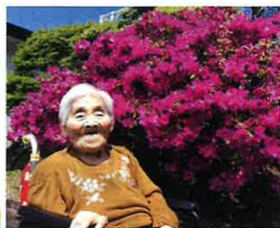
満開のやすおか荘のツツジ