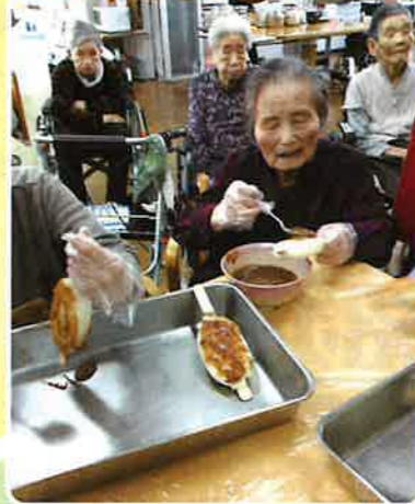
型を取るのも大変だ～