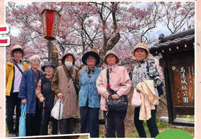
こすも ～越百の水～ (与田切公園内)