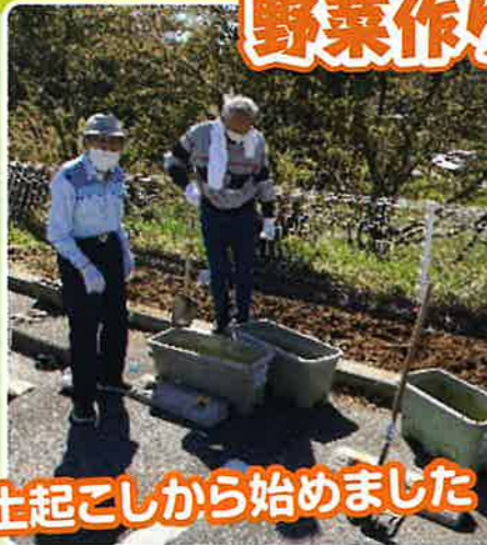
土起こしから始めました

「デイサービスで野菜を作りたいね」 そんな声からテラスのプランターで野菜作りを始めました。たくさんやることはありますが、野菜作りのプロ(利用者様)に聞きながら美味しい野菜を育てたいと思います。