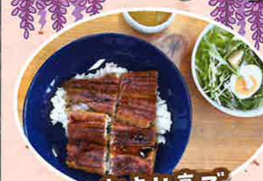
おより亭で 特大な丼食べました!